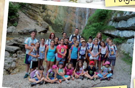
Folgaria • Campo elementari