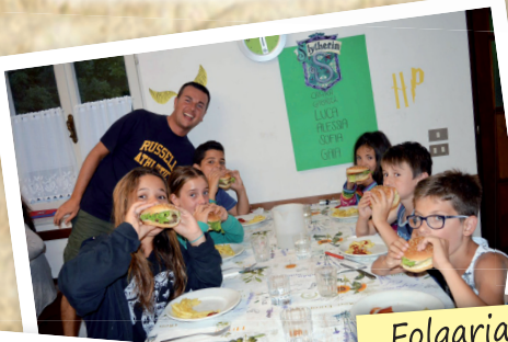
Folgaria • Campo Medie